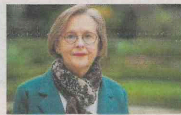
Annie Vidal (Renaissance) députée de la 2e circonscription de la Seine-Maritime au sein du groupe Ensemble pour la République :

« C'est original de déposer sa propre motion de censure contre soi-même ! Maintenant, je joue aux échecs alors je m'interroge : qu'ont-ils imaginé pour la suite ? Car rien n'est jamais gratuit. Soit Emmanuel Macron va faire un coup et donner le pouvoir à la gauche parce qu'il voit qu'elle est capable de bloquer le pays et qu'il y a, à gauche, de plus en plus, une tendance, une dynamique collective. Donc, il nous « refille le bébé » pour que l'on redresse la situation. Allez, j'ai le droit d'imaginer qu'il a un moment de lucidité, non ? Parce que, sinon, je pense plutôt que cela a été dealé avec la droite. Puisque c'est la grande finance qui dirige, quelques-uns à droite sont prêts à y aller et à s'acquiescer avec l'extrême droite... J'y vois en tout cas une volonté de désamorcer le mouvement du 10 septembre parce que le pouvoir s'est rendu compte que les gens sont prêts à bouger et que l'injustice ne passe pas. »