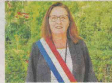
Katiana Levavasseur, députée de la 2e circonscription de l'Eure au sein du groupe Rassemblement national :

le RN [qui ont déjà indiqué qu'ils ne voteront pas la confiance, NDLR]. C'est très risqué car s'il n'a pas le vote de confiance, c'est la démission et une crise politique, économique, démocratique et sociale épouvantable ! Peut-être suis-je utopique et que certaines personnes mesureront bien les enjeux. Qu'ils voteront en pleine conscience pour éviter de se plonger dans ce chaos... »