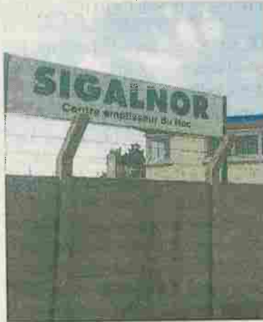
À l'heure actuelle, le site est détenu par des actionnaires différents