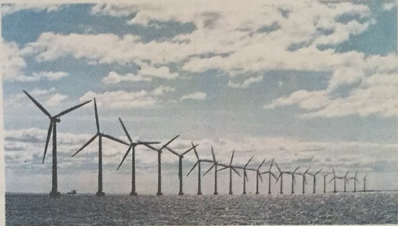
La filière industrielle de l'éolien au Havre, véritable serpent de mer...

Le gouvernement aurait confirmé le désengagement d'Areva (dont l'État est actionnaire à 90 %) de l'entreprise offshore Adwen et validerait à la rentrée le choix du repreneur des parts (50 % pour Areva ; l'Espagnol Gamesa possédant les autres 50 %). Les deux principaux candidats sont l'Allemand Siemens et l'Américain General Electric. Trois critères conditionneraient ce choix, rapportent les deux élus : le prix du rachat, la garantie des premières livraisons par Adwen et l'engagement de création d'usines en France. « Compte tenu du surcoût important de l'éolien maritime sur le terrestre, nous avons rappelé que la création de la filière, et par conséquent des emplois promis, était non négociable, soutiennent les deux élus. Personne