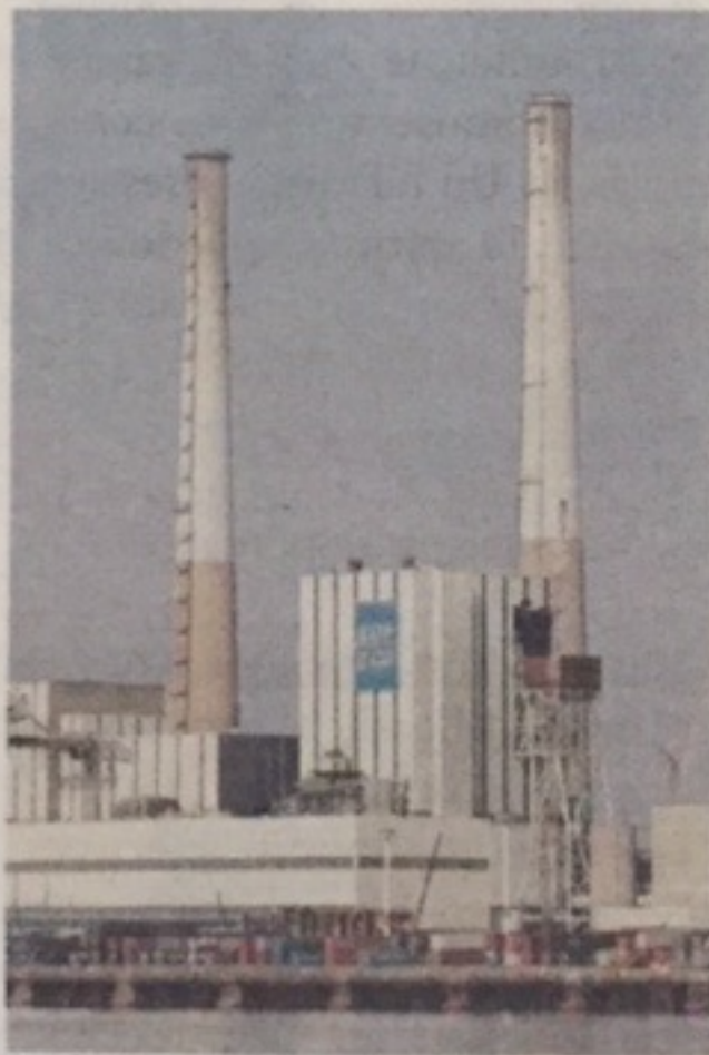
La fermeture de la centrale ne serait qu'un effet d'annonce

Sur l'avenir de la centrale thermique , « le cabinet s'est montré rassu-